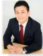
仲光和之氏 株式会社 ソウルスウェット カンパニー

最高の講師がみなさんの学びを全力でサポートします。価値ある場であることをお約束します。